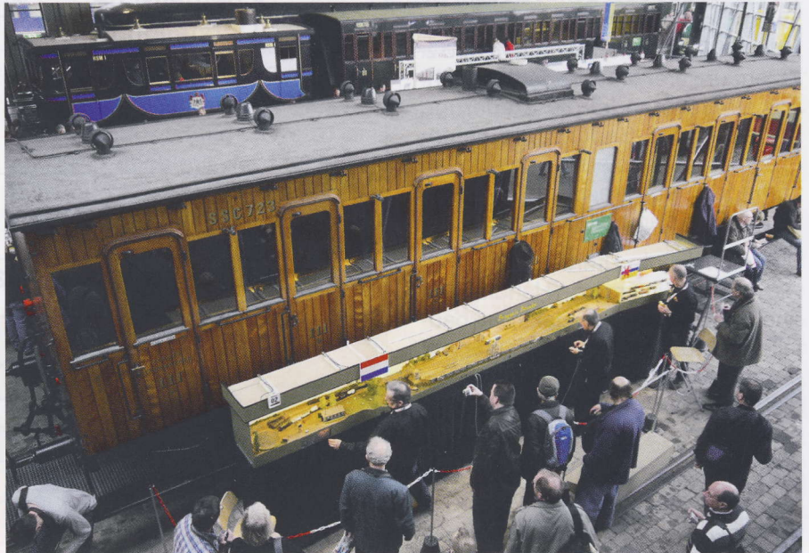
Ein wunderschönes Original und davor die Anlage „Braggels Baenke“ aus Roermond (NL)

Gegenüber dem Jahre 2010 wurde das Museumsgelände umgestaltet und 30 neue Exponate von den besten Modellbahnanlagen und Schaustücken konnten die Besucher bestaunen. Aus England, Polen, Belgien, Frankreich den Niederlanden und